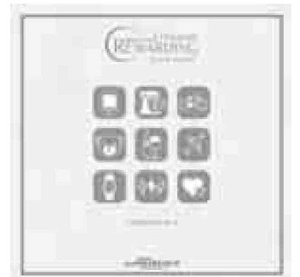
La copertina del catalogo di Mediolanum Freedom Rewarding

La differenza importante non è circoscritta a 100 o 200 euro di convenienza tra un'offerta e l'altra, ma si estende all'intero servizio e alla sua qualità: alla qualità del rapporto tra banca e cliente. Per questo è importante scegliere la banca "giusta". Che non è più la banca più vicina a casa come lo era un tempo. Ora che le tecnologie di rete rendono a portata di mano tutte le operazioni e i servizi più semplici e quotidiani. In ogni momento, in modo veloce e da qualsiasi luogo. Ma la banca "giusta" oggi è innanzitutto la banca più adatta al cliente e alle sue esigenze. E i clienti cercano e si aspettano un servizio eccellente, condizioni vantaggiose, un'assistenza adeguata per ogni necessità, soprattutto per quanto riguarda le scelte, le operazioni e le decisioni più importanti e delicate. Nella valutazione e nella scel-