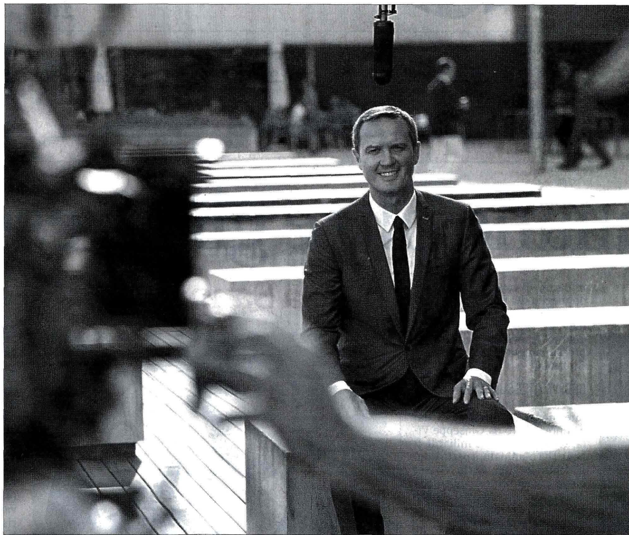
Sopra: un'immagine di backstage scattata sul set durante le riprese dello spot pubblicitario che è stato girato a Barcellona lo scorso ottobre e che vede come protagonista Massimo Doris, amministratore delegato di Banca Mediolanum e alcuni fermi immagine dello spot stesso

Dai classici prodotti "da sportello" come i conti correnti o il conto deposito che Mediolanum offre, a mutui e prestiti, senza tralasciare la tutela e la sicurezza della persona attraverso strumenti assicurativi e previdenziali: il gruppo guidato da Massimo Doris copre dunque ogni ambito della vita dei propri clienti e, aspetto tutt'altro che se-