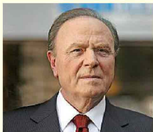
di Ennio Doris*

Siamo alla vigilia di una svolta epocale. Banca Mediolanum è pronta per accompagnare i suoi clienti a coglierne le opportunità. La svolta nasce dalla tecnologia che, da quando esiste, sempre sovverte l'ordine in una specie di rivoluzione silenziosa ma inarrestabile. A darle un'accelerazione è stata la crisi finanziaria e poi economica.