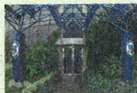
L'ingresso della Mediolanum Corporate University (MCU) a Milano

sumi, le aziende riorganizzate e snellite durante la crisi lavorano a pieno ritmo e sono piene di soldi da impiegare come mai in precedenza, i reinvestimenti negli ultimi sei mesi sono aumentati del 60% rispetto a un anno fa. Quest'anno la crescita economica sarà del 3,5%, a due cifre il rendimento dei titoli azionari. Sono in fase di espansione i settori energia, tecnologia, servizi sanitari. La notizia che la convocazione del mercato azionario americano è termina-