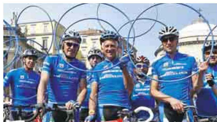
Da sinistra Moser, Motta e Fondriest, storici testimonial Mediolanum al Giro

gia l'esperienza di Banca Mediolanum. Come sempre, anche per l'edizione 2015 la presenza di Banca Mediolanum al Giro d'Italia, che si concluderà a Milano il 31 maggio, sarà arricchita da pranzi esclusivi su invito lungo il percorso, cene di gala in location di eccezione, pedalate amatoriali e tante altre iniziative parallele alla manifestazione sportiva caratterizzate dalla presenza di testimonial d'eccezione tra i quali Francesco Moser (dal 2003), Gianni Motta (dal 2004), Maurizio Fondriest (dal 2004) e Paolo Bettini