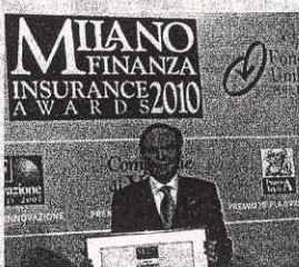
Il presidente del Gruppo Mediolanum, Ennio Doris

età miserevole, in vista dell'inevitabile taglio delle pensioni pubbliche, della revisione degli indici di sopravvivenza e dell'innalzamento dell'età pensionabile» ha osservato Ennio Doris, avvertendo che «i quarantenni di oggi devono rifare attentamente i loro calcoli ipotizzando che la loro pensione si possa ridurre alla metà o addirittura a un terzo». Di qui la grande, storica opportunità per le compagnie di assicurazione, in grado di