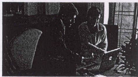
Consulenza finanziaria specializzata con i Global Banker

Mediolanum, «una sfida che invito tutti a cogliere, dato che Banca Mediolanum mette a disposizione dei propri professionisti tutti gli strumenti necessari per continuare a sviluppare la propria attività, dall'aggiornamento continuo alla formazione specializzata». Sempre nel segno di un servizio di qualità e fiducia rivolto alla clientela.