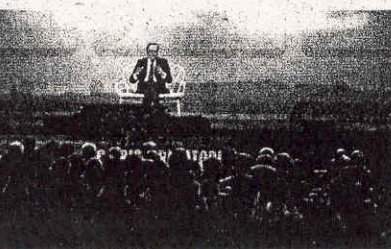
Ennio Doris nel corso della conferenza stampa al teatro Manzoni di Milano

Già in giugno la banca aveva annunciato che dal 1° settembre avrebbe ridotto unilateralmente, cioè automaticamente, senza alcuna contrattazione da parte del cliente, i mutui bancari sia ai clienti nuovi sia a quelli vecchi,