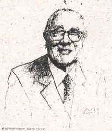
finanziere e scrittore di economia

qualsiasi effetto positivo. Per quanto riguarda gli USA, la violazione di quota 1280 dello S.P500 condurrebbe a una caduta fino a 1160: cioè dai massimi di 1550 la perdita sarebbe del 25% e da inizio anno del 22,5%. Secondo me il mese peggiore potrebbe essere luglio che racco-