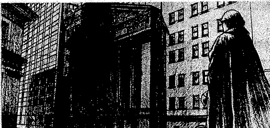
Nel disegno uno scorcio di Wall Street e dello Stock Exchange di New York

Il giro di boa del nuovo anno, in un'ottica di più lungo periodo, ha rappresentato una svolta non solo sul calendario, ma anche sullo scenario economico e finanziario internazionale. La crisi libica di questi ultimi giorni ha scosso la Borsa, i contraccolpi immediati e legati ai fatti di attualità risultano variabili, dopo che invece le rivolte e i mutamenti politici in Egitto e Tunisia non avevano provocato conseguenze rilevanti per i listini. Ma numerosi fattori, dati e segnali di carattere strutturale, sul panorama economico e finanziario globale, indicano la possibilità di proseguire con decisione sulla strada della ripresa, e rappresentano importanti presupposti per guardare con fiducia alle prospettive di medio e lungo periodo. Al di là delle oscillazioni dei mercati più contingenti e di breve, a volte di brevissima durata. Innanzitutto, dopo un 2010 di turbolenze, timori e incertezze, soprattutto sullo scenario macro-economico europeo, dopo le crisi finanziarie di Grecia e Irlanda dello scorso anno, le tensioni sul debito sovrano di alcuni Paesi dell'area euro suscitano minore preoccupazione grazie all'iniziativa di Governi e istituzioni internazionali. Ma sono del resto diversi altri i segnali, i dati e risultati, che portano a questa svolta. «Il quadro economico globale mostra indubbi segni di vitalità» rileva Vittorio Gaudio, amministratore delegato di Mediolanum Gestione Fondi, «e le dinamiche al rialzo dell'inflazione, per ora moderata,