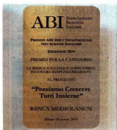
Il premio assegnato dall'ABI

aiuto concreto anche nelle situazioni di difficoltà e bisogno, siano esse momenti di tensione finanziaria (nel cui quadro si inserisce l'attuale taglio dello 'spread' sui mutui), oppure disagi dovuti alle calamità naturali. È proprio in queste ultime occasioni che l'impegno di Banca Mediolanum si traduce in una vera e propria esperienza solidale e sostenibile a sostegno dei propri clienti e più in generale di tutti coloro che vengono colpiti da varie avversità. Solamente nel corso del 2013, in seguito alle numerose alluvioni che hanno colpito diverse regioni italiane, Banca Mediolanum è intervenuta stanziando 1.600.000 euro a favore delle famiglie dei clienti e Family Banker che hanno subito danni. Oltre a ciò, sono state previste diverse agevolazioni tra le quali la possibilità di sospensione della rata mutui e prestiti