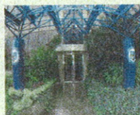
L'ingresso della Mediolanum Corporate University (MCU) a Milano

L'agenzia pubblicitaria Red Cell, del Gruppo WPP, si è aggiudicata la gara