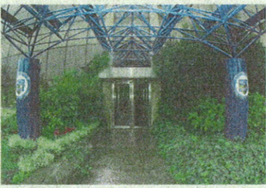
L'ingresso di Mediolanum Corporate University (MCU) presso la sede della Banca a Milano

Con l'obiettivo di formare i Family Banker del futuro, i professionisti finanziari d'eccezione, attraverso un percorso di studi di altissimo livello, dalla collaborazione tra il MIP - la Business School del Politecnico di Milano -, e Mediolanum Corporate University (MCU) - l'università aziendale di Banca Mediolanum -, nasce il Master Universitario in Family Banking.