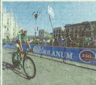
Banca Mediolanum ha sponsorizzato la Maglia Verde del Giro d'Italia per il nono anno consecutivo, vinta da Stefano Garzelli

Il Giro d'Italia che ha tagliato a Milano il traguardo finale il 29 maggio è stato, come ormai di consueto, un successo anche per Banca Mediolanum e i suoi Family Banker. Per il nono anno consecutivo la Banca ha sponsorizzato la Maglia Verde, quella che dal 1974 viene assegnata a chi si aggiudica il Gran Premio della Montagna: trofeo conquistato da Stefano Garzelli, già vincitore nel 2009. Per la Banca il Giro, cambiando ogni anno percorso e località attraversate, fornisce l'occasione per incontrare clienti e potenziali clienti, e condividere con loro momenti di passione sportiva, divertimento, svago. Un'esclusiva assoluta nel rapporto tra una banca e la propria clientela. E anche quest'anno i numeri e i risultati conseguiti sono da record: oltre 30mila i partecipanti al concorso presso gli stand Mediolanum, 1.300 le presenze all'interno delle aree "hospitality" allestite in partenza e arrivo di ogni tappa, 11 gli eventi organizzati nei Family Banker Office presenti lungo il percorso con oltre 1.300 partecipanti. E ancora: 18 le serate esclusive Mediolanum Party, con oltre 4.500 invitati, e 4 gli eventi PrimaFila dedicati a un totale di circa 200 partecipanti. E poi non sono mancate le tradizionali "pedalate", che sono state 36 quest'anno,