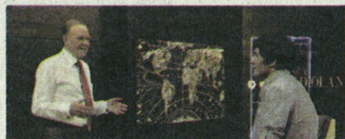
Ennio Doris durante la registrazione dello spot realizzato per la nuova campagna