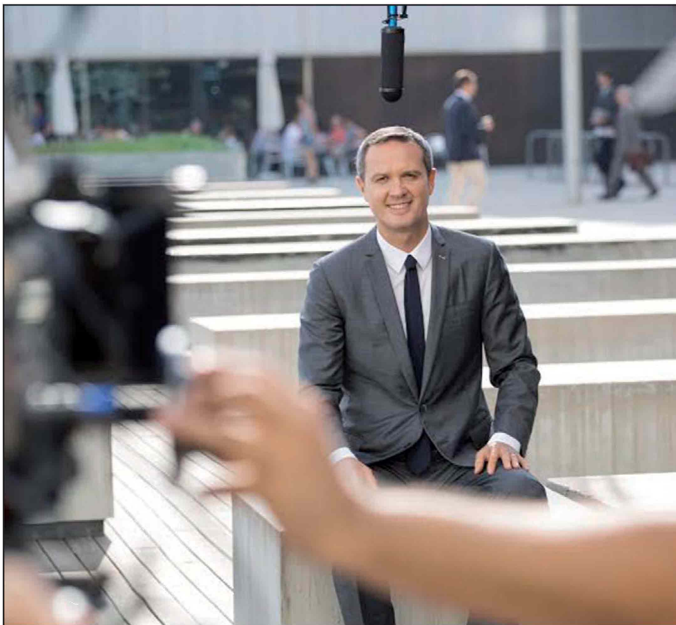
Sopra un'immagine di backstage scattata sul set durante le riprese dello spot pubblicitario che è stato girato a Barcellona lo scorso ottobre e che vede come protagonista Massimo Doris, amministratore delegato di Banca Mediolanum ed alcuni fermi immagine dello spot stesso

voli: perché un'altra prerogativa essenziale di Mediolanum è senza dubbio la trasparenza nella propria offerta, chiara, semplice e diretta. I prodotti offerti certo sono numerosi, ma correre il rischio