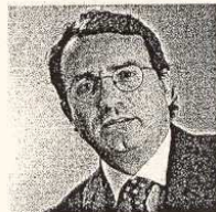
Antonio Maria Penna, amministratore delegato di Banca Mediolanum

banca e formati all'interno, con un training specifico, appositamente studiato per soddisfare tutte le possibili esigenze della clientela. L'operatore del Banking Center ha, in pratica, non solo tutte le competenze e le funzioni di un addetto allo sportello bancario, ma molte altre in più, dato che è in grado di gestire dai normali servizi bancari, come bonifici e transazioni, alle operazioni di investimento, dalle sottoscrizioni di polizze assicurative alle richieste d'informazioni, dalle operazioni di pagamento alle com-