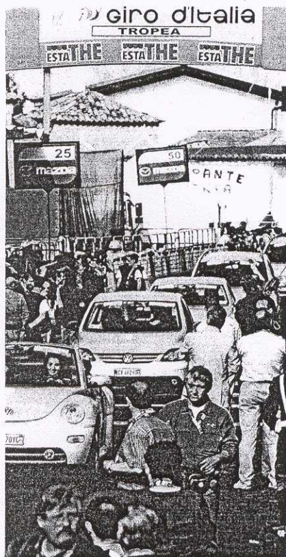
La carovana di Banca Mediolanum al Giro d'Italia 2005

I migliori clienti potranno pedalare con i campioni di ieri (Francesco Moser, Gianni Motta, Maurizio Fondriest, Roberto Conti), seguire la corsa su una macchina dell'azienda e partecipare ai Mediolanum party