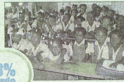
Ogni nuovo conto corrente Freedom che verrà aperto, fino al 31 marzo 2011, Banca Mediolanum garantirà un mese di scuola a un bambino di Haiti, sostenendo le attività della Fondazione Francesca Rava N.P.H. Italia Onlus, in stretta collaborazione con Fondazione Mediolanum. In sostanza, convenienza, vantaggi e solidarietà, insieme in un conto corrente. Unico, sotto tutti gli aspetti.

In più per i nuovi correntisti, che apriranno per la prima volta un conto corrente Freedom, la remunerazione delle somme in garanzia oltre i 15mila euro risulta ancora più vantaggiosa, con un tasso di remunerazione del 2,20% netto, che rispetto alle condizioni di un conto corrente ordinario corrisponde al 3% lordo. Cifre che svettano sempre rispetto a quanto disponibile sul mercato bancario. E, oltre all'eccezionale livello di convenienza, i vantaggi del conto corrente Freedom riguardano anche le condizioni dell'operatività bancaria. Costo del conto corrente: zero, con una garanzia media pari a 15mila euro, o con un patrimonio finanziario gestito oltre i 30mila euro. Negli altri casi: 7,50 euro al mese, tutto incluso. Principali operazioni bancarie, prelievi Bancam, bonifici, RID, pagamento utenze, gratuiti. Potendo sempre scegliere liberamente il modo con cui "entrare" in banca (internet, telefono, Banca Center (oltre 400 professionisti specializzati, a disposizione dal lunedì al venerdì, dalle 8 alle 22, e anche il sabato mattina), sportelli convenzionati (oltre 15mila in tutta Italia). E in più, per la massima tranquillità e consulenza di fiducia, il Family Banker (una rete di circa 5mila professionisti finanziari, in tutte le città e province del Paese) segue e assiste personalmente ogni singolo cliente, in maniera costante e continuativa nel tempo. Ma le