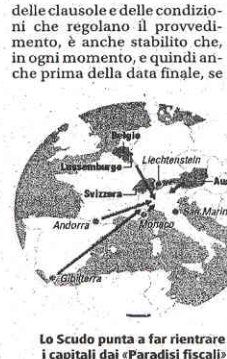
Lo Scudo punta a far rientrare i capitali dai 'Paradisi fiscali'

Lo Scudo fiscale 2009 si realizza del resto in un contesto molto diverso, ad esempio, da quello del 2001-2002: allora il governo italiano varò quel provvedimento come iniziativa isolata a livello internazionale, oggi i Paesi del G8 e del G20 si sono