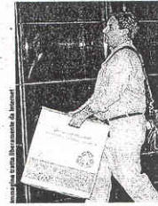
Un ex-dipendente Lehman svuota gli uffici dopo il crac

Un anno fa scoppiava il caso Lehman Brothers. Una delle più prestigiose banche d'affari americane chiudeva i battenti travolta dai debiti generati dalla cattiva finanza a stelle e strisce. Un colosso che segnò il momento più acuto e aprì il baratro più profondo della crisi americana, che da Wall Street si è poi allargata a livello internazionale.