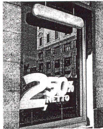
Il Family Banker Office di via Larga nel centro di Milano

Uno degli uffici è stato aperto all'interno del Mediolanum Forum di Assago, una delle più popolari arene lombarde