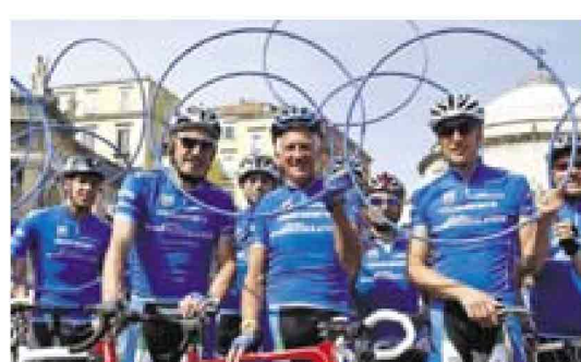
Da sinistra Moser, Motta e Fondriest, storici testimonial Mediolanum al Giro

Per il tredicesimo anno consecutivo Banca Mediolanum è salita in sella prendendo parte alla 98esima edizione del Giro d'Italia, partenza da Sanremo il 9 maggio. E lo ha fatto ancora una volta come sponsor del Gran Premio della Montagna con la maglia azzurra, dedicata al miglior "scalatore", simbolo di italianità ma non solo: anche di impegno, sacrificio, e forza del singolo individuo ma allo stesso tempo della capacità di fare squadra e del lavoro di gruppo. Concetti in profonda sintonia con i valori e la filosofia sui quali poggia l'esperienza di Banca Mediolanum. Come sempre, anche per l'edizione 2015 la presenza di Banca Mediolanum al Giro d'Italia, che si concluderà a Milano il 31 maggio, sarà arricchita da pranzi esclusivi su invito lungo il percorso, cene di gala in location di eccezione, pedalate amatoriali e tante altre iniziative parallele alla manifestazione sportiva caratterizzate dalla