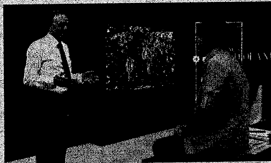
Un momento dello spot televisivo con il Presidente di Banca Mediolanum, Ennio Doris