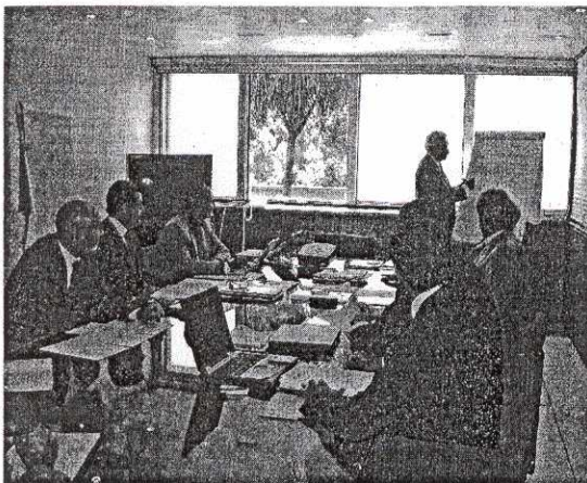
Un gruppo di Consulenti assiste ai corsi di formazione

Il correntista può decidere in piena autonomia luoghi, tempi e modalità delle operazioni bancarie