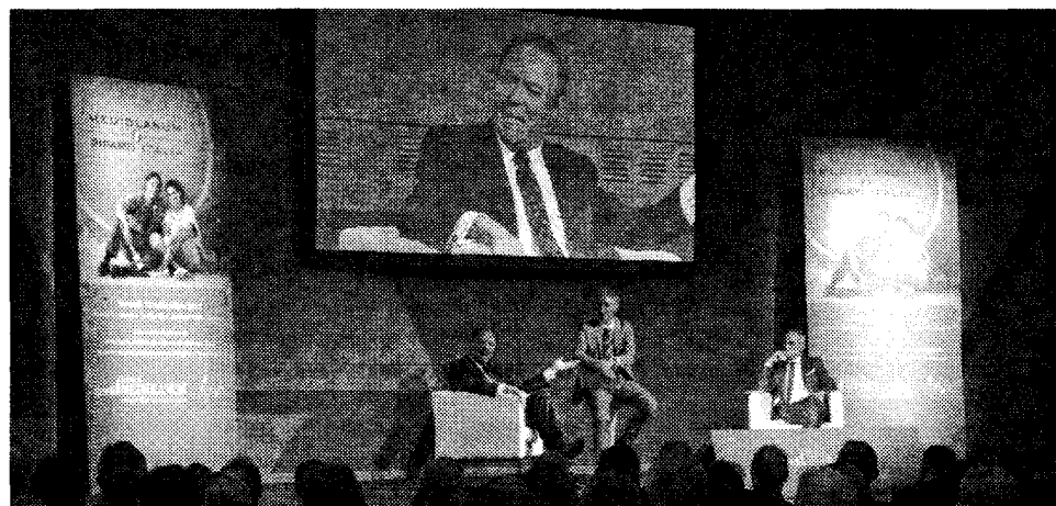
Una delle serate "Riparti Italia" che si sono svolte in tutta Italia con Ennio Doris.