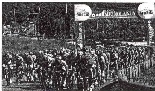
Il Giro d'Italia per Banca Mediolanum rappresenta l'occasione per incontrare clienti e pubblico