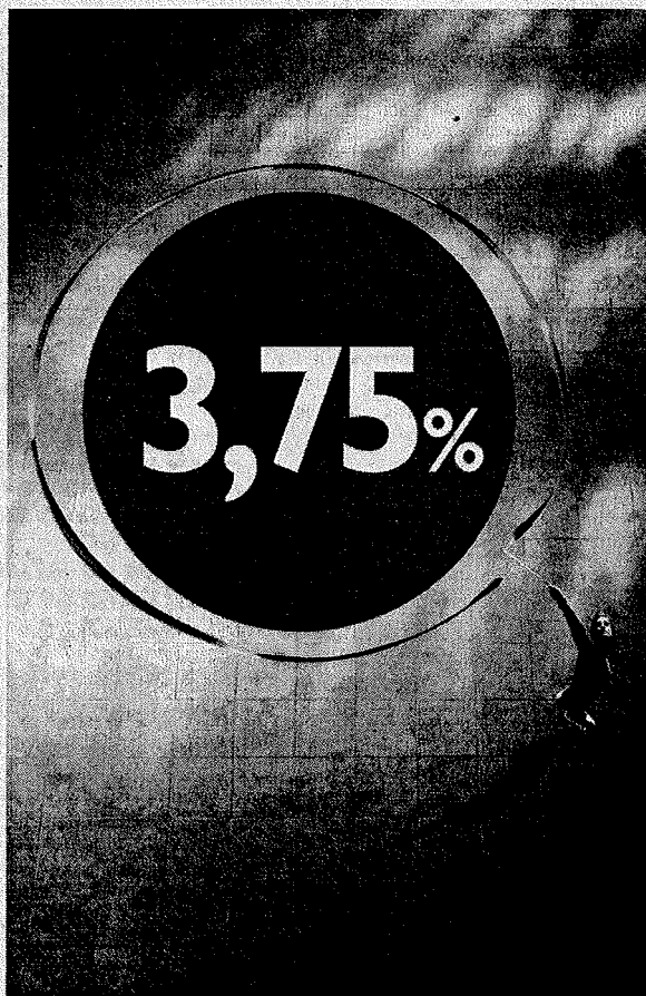
Un fermo immagine della campagna pubblicitaria per il conto deposito InMediolanum

Basti guardare alle azioni e alle scelte concrete fatte nell'ultimo periodo. Fino allo scorso luglio, le stime dei tassi erano in crescita, seppure graduale, e già in quello scenario i tassi di remunerazione applicati da Banca Mediolanum erano costantemente ai vertici del mercato. Ma a partire da agosto, la situazione è fortemente mutata, e ora le stime prevedono, per i prossimi mesi, una significativa discesa dei tassi. Anche in questo nuovo quadro, Banca Mediolanum ha deciso di 'investire' sui propri clienti, aumentando il tasso del conto deposito InMediolanum dal 3,50% al 3,75% lordo annuo per le somme