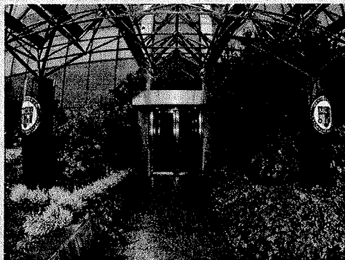
L'ingresso della sede MCU a Basiglio (Milano)

via telefono; oggi li anticipa non solo adottando tutte le tecnologie, dalle più avanzate alle più semplici, da quelle ancora elitarie a quelle più diffuse, dalle più complesse alle più intuitive, perché ogni cliente possa scegliere quella che più gli è comoda. Li anticipa anche conti-