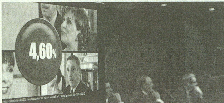
Un momento della conferenza stampa di presentazione di InMediolanum Friends

1 Ad eccezione delle imposte di legge vigenti. 2 Sui nuovi vincoli attivati entro 31/12/2012, fino al tasso del 4% verranno riconosciuti anticipi trimestrali sugli interessi che matureranno alla scadenza del vincolo. Condizioni contrattuali, Regolamento promozione InMediolanum Friends e Fogli Informativi su InMediolanum.it e presso i Family Banker®.