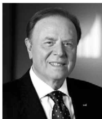
Ennio Doris spiega il successo di un modello che è riuscito a battere la crisi