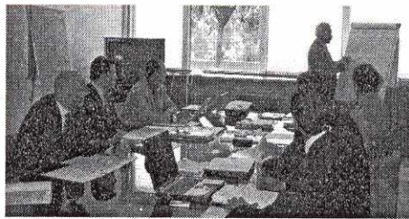
Un gruppo di consulenti durante il corso di formazione

In Banca Mediolanum, però, da ben quindici anni, l'aggiornamento professionale viaggia anche sulla televisione aziendale (si veda anche l'articolo in pagina), che avvalendosi di trasmissioni dedicate, si è dimostrata molto più efficace di qualsiasi tipo di documentazione cartacea. Rappresenta uno strumento formativo e informativo al contempo: consente all'agente di approfondire novità e problematiche della consulenza finanziaria e all'azienda di intervenire tempestivamente nei momenti di difficoltà dettati dal-