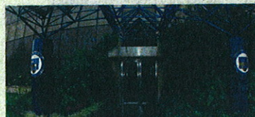
L'ingresso di Mediolanum Corporate University (MCU) a Milano