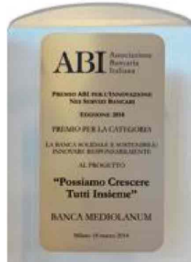
Il premio assegnato dall'ABI

Solamente nel corso del 2013, in seguito alle numerose alluvioni che hanno colpito diverse regioni italiane, Banca Mediolanum è intervenuta stanziando 1.600.000 euro a favore delle famiglie dei clienti e Family Banker che hanno subito danni. Oltre a ciò, sono state previste diverse agevolazioni tra le quali la possibilità di sospensione della rata mutui e prestiti per 12 mesi, l'attivazione di linee di credito privilegiate, la riduzione di un punto per-