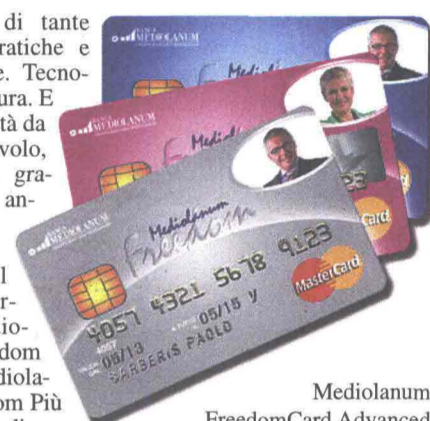
Mediolanum FreedomCard Advanced

Sottoscrivendo il conto corrente Mediolanum Freedom One o Mediolanum Freedom Più