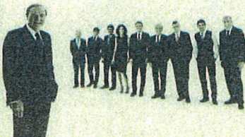
Un'immagine dello spot Tv per il lancio del nuovo spazio di Banca Mediolanum su YouTube. In primo piano, Ennio Doris

Facebook, Twitter, e ora anche YouTube. Banca Mediolanum utilizza le tecnologie più moderne, gli strumenti hi-tech più pratici e funzionali, per comunicare con i propri clienti, e con tutti i risparmiatori e le loro famiglie, ogni giorno, in ogni momento della giornata, da qualsiasi luogo. Dopo essere approdati sui principali social network, come Facebook e Twitter, dal 15 luglio Banca Mediolanum avrà il proprio brand channel su YouTube, dove saranno disponibili notizie, presentazioni e novità di Banca Mediolanum, i suoi servizi e soluzioni per il risparmio e gli investimenti delle famiglie, eventi rivolti alla clientela, e tante iniziative e attività organizzate in tutta Italia e in ogni periodo dell'anno: dal Mediolanum Market Forum alla sponsorizzazione del Giro d'Italia. Per lanciare in grande stile il nuovo spazio della Banca su YouTube, dal 15 al 21 luglio andrà in on-