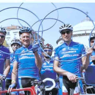
Da sinistra Moser, Motta e Fondriest, storici testimonial Mediolanum al Giro

Per il tredicesimo anno consecutivo Banca Mediolanum è salita in sella prendendo parte alla 98esima edizione del Giro d'Italia, partenza da Sanremo il 9 maggio. E lo ha fatto ancora una volta come sponsor del Gran Premio della Montagna con la maglia azzurra, dedicata al miglior "scalatore", simbolo di italianità ma non solo: anche di impegno, sacrificio, e forza del singolo individuo ma allo stesso tempo della capacità di fare squadra e del lavoro di gruppo. Concetti in profonda sintonia con i valori e la filosofia sui quali poggia l'esperienza di Banca Mediolanum. Come sempre, anche per l'edizione 2015 la presenza di Banca Mediolanum al Giro d'Italia, che si concluderà a Milano il 31 maggio, sarà arricchita da pranzi esclusivi su invito lungo il percorso, cene di gala in location di eccezione, pedalate amatoriali e tante altre iniziative parallele alla manifestazione sportiva caratterizzate dalla presenza di testimonial d'eccezione tra i quali Francesco Moser (dal 2003), Gianni Motta (dal 2004), Maurizio Fondriest (dal 2004) e Paolo Bettini (dal 2010). Un insieme di eventi creati ad hoc che gli anni hanno attirato decine di migliaia di persone e che sono stati quotidianamente seguiti e documentati sui principali network grazie a un sapiente lavoro di squa-