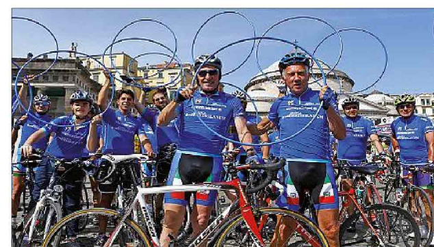
La pedalata amatoriale riservata ai clienti Mediolanum è una delle iniziative tradizionali della Banca legate al Giro d'Italia

impegno e forza del singolo individuo ma allo stesso tempo frutto del lavoro di gruppo, della capacità di fare squadra e della sinergia: in altre parole proprio degli stessi valori sui quali si fonda la strategia e la forza stessa di Banca Mediolanum, che grazie alla propria squadra di lavoro riesce a rispondere ed esaudire i desi-