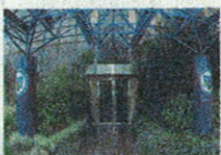
L'ingresso della Mediolanum Corporate University (MCU) a Milano

sumi, le aziende riorganizzate e snellite durante la crisi lavorano a pieno ritmo e sono piene di soldi da impiegare come mai in precedenza, i reinvestimenti negli ultimi sei mesi sono aumentati del 60% rispetto a un anno fa. Quest'anno la crescita economica sarà del 3,5%, a due cifre il rendimento dei titoli azionari. Sono in fase di espansione i settori energia, tecnologia, servizi sanitari. La notizia che la consuevole del mercato azionario americano è termina-