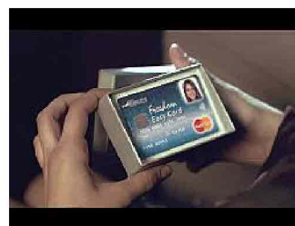
Sopra un'immagine di backstage scattata sul set durante le riprese dello spot pubblicitario che è stato girato a Barcellona lo scorso ottobre e che vede come protagonista Massimo Doris, amministratore delegato di Banca Mediolanum ed alcuni fermi immagine dello spot stesso.

per affiancare la clientela e assisterla nelle proprie scelte. Sia in termini di selezione dei prodotti sia di investimenti. Ricordiamo ad esempio il servizio di Banking Center, un vero e proprio sportello bancario a "uno squillo di distanza", composto da oltre 400 specialisti a cui è possibile rivolgersi per richiedere assistenza operativa e informazioni. Strumenti dunque versatili che consentono al cliente di muoversi e operare in massima libertà con la certezza allo stesso tempo di non incorrere in sorprese spiacevoli: perché un'altra prerogativa essenziale di Mediolanum è senza dubbio la trasparenza nella propria offerta, chiara, semplice e diretta. I prodotti offerti certo sono numerosi, ma correre il rischio di smarrirsi tra le innumerevoli proposte è impossibile: proprio per indirizzare il cliente verso le scelte più adatte ci sono in prima fila i Family Banker, figura chiave del gruppo Mediolanum e punto di relazione tra la banca stessa e la clientela. Una vera e propria rete di esperti presenti ovunque, nelle città e nelle province, capace di garantire vicinanza reale e concreta alla clientela e di seguirla nelle scelte e decisioni di risparmio e investimento, portando ancora una volta la Banca a casa del cliente.