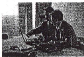
Il Family Banker, consulenza di fiducia