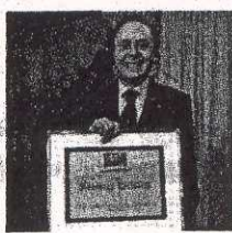
Ennio Doris ritira il Premio Guido Carli

Quattro nuovi e prestigiosi riconoscimenti si aggiungono al già fitto palmarès di Mediolanum. Lunedì 16 marzo, a Milano, si è svolta la cerimonia di premiazione degli MF-Milano Finanza Global Awards 2009: nel corso di un "charity dinner", i Global Awards di Milano Finanza si dividono in cinque categorie di premi singoli: Tripla A, MF Innovazione Award, Guido Carli, Creatori di Valore e Leone d'Oro. È il Gruppo Mediolanum ha fatto inetta dei premi dedicati ai protagonisti e alle più importanti società del mondo bancario, finanziario e della comunicazione, che hanno realizzato le migliori performance nel corso del 2008. Il Premio