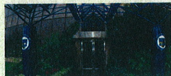
L'ingresso di Mediolanum Corporate University (MCU) a Milano