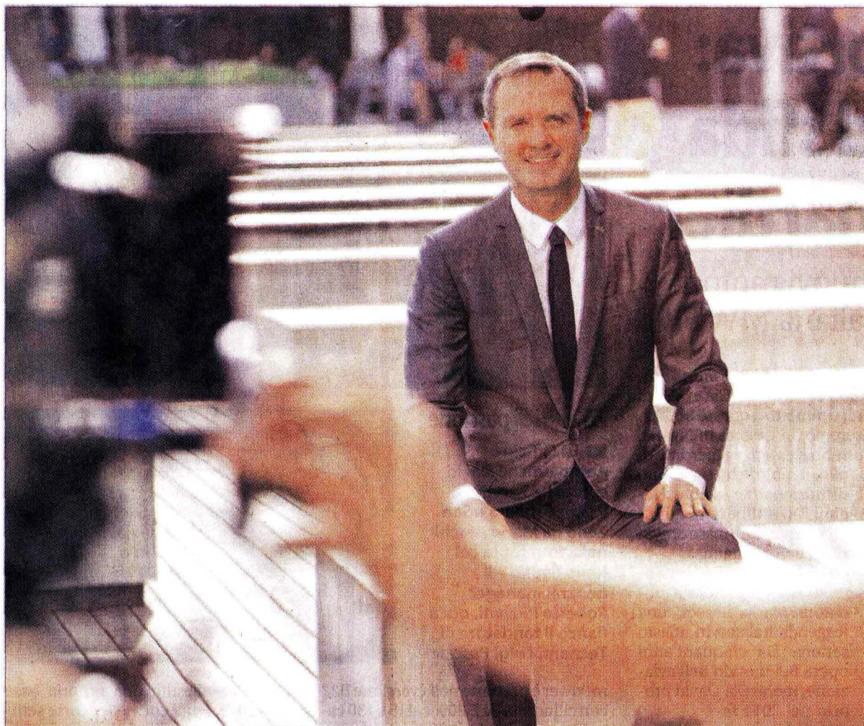
Sopra: un'immagine di backstage scattata sul set durante le riprese dello spot pubblicitario che è stato girato a Barcellona lo scorso ottobre e che vede come protagonista Massimo Doris, amministratore delegato di Banca Mediolanum ed alcuni fermi immagine dello spot stesso

Strumenti dunque versatili che consentono al cliente di muoversi e operare in massima libertà