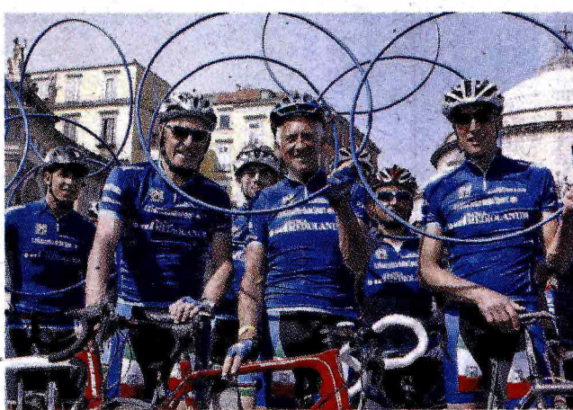
Da sinistra Moser, Motta e Fondriest, storici testimonial Mediolanum al Giro

Per il tredicesimo anno consecutivo Banca Mediolanum è salita in sella prendendo parte alla 98esima edizione del Giro d'Italia, partenza da Sanremo il 9 maggio. E lo ha fatto ancora una volta come sponsor del Gran Premio della Montagna con la maglia azzurra, dedicata al miglior "scalatore", simbolo di italianità ma non solo: anche di impegno, sacrificio, e forza del singolo individuo ma allo stesso tempo della capacità di fare squadra e del lavoro di gruppo. Concetti in profonda sintonia con i valori e la filosofia sui quali poggia l'esperienza di Banca Mediolanum. Come sempre, anche per l'edizione 2015 la presenza di Banca Mediolanum al Giro d'Italia, che si concluderà a Milano il 31 maggio, sarà arricchita da pranzi esclusivi su invito lungo il percorso, cene di gala in location di eccezione, pedalate amatoriali e tante altre iniziative parallele alla manifestazione sportiva caratterizzate dalla presenza di testimonial d'eccezione tra i quali Francesco Moser (dal 2003), Gianni Motta (dal 2004), Maurizio Fondriest (dal 2004) e Paolo Bettini (dal 2010). Un insieme di eventi creati ad hoc che gli anni hanno attirato decine di migliaia di persone e che sono stati quotidianamente seguiti e documentati sui principali