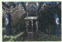
L'ingresso della Mediolanum Corporate University (MCU) a Milano

sumi, le aziende riorganizzate e snellite durante la crisi lavorano a pieno ritmo e sono piene di soldi da impiegare come mai in precedenza, i reinvestimenti negli ultimi sei mesi sono aumentati del 60% rispetto a un anno fa. Quest'anno la crescita economica sarà del 3,5%, a due cifre il rendimento dei titoli azionari. Sono in fase di espansione i settori energia, tecnologia, servizi sanitari. La notizia che la convalescenza del mercato azionario americano è termina-