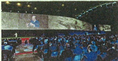
Un'immagine dell'evento di Rimini per i Family Banker Mediolanum

"InMediolanum" porta un'altra importante novità, la possibilità per il cliente di aprire e gestire in autonomia il Conto Deposito, direttamente dal sito www.inmediolanum.it . Entrare in questo sito significa entrare in Banca Mediolanum: liberamente, senza impegno, con un'operazione facilissima, alla portata di tutti, e avere una remunerazione della liquidità tra i massimi livelli di mercato. Il cliente può in qualsiasi momento disporre del suo denaro, anche svincolando anticipatamente le somme depositate per il periodo di vincolo, senza costi, beneficiando comunque di un tasso di remunerazione base interessante oggi pari all'1% annuo lordo. Il denaro può essere movimentato liberamente attraverso bonifici sia in ingresso sia in uscita da/verso altri conti intestati al cliente. L'accesso diretto non sostituisce la figura del Family Banker, perno del mo-