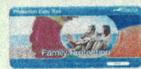
La polizza di protezione possono garantire alla famiglia il mantenimento del livello di vita acquisito

del capofamiglia, dal cui senso di responsabilità dipende la qualità dell'esistenza di coniuge e figli, è garantire alla famiglia il mantenimento del livello di vita. E come si fa, in un momento come l'attuale in cui crisi finanziaria ed economica si accavallano e moltiplicano i loro effetti? Le «polizze di protezione» sono una risposta. Autorevoli ricerche rivelano che se quattro anni fa era «no» la risposta dell'italiano medio alla domanda «sente il bisogno di proteggerli?», oggi è «sì», con i dubbi che ne conseguono: con chi mi assicurò? posso permettermelo? Quando si tratta di ragionare di assicurazioni, il primo passo è fare ordine. «Mediolanum Assicurazioni», spiega Massimo Grandis, «ha