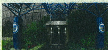
L'ingresso di Mediolanum Corporate University (MCU) a Milano