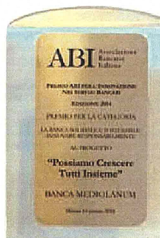
Der von ABI verliehene Preis

Situationen und Notlagen konkrete Hilfe leisten, sei es im Fall angespannter Finanzlage (so zum Beispiel durch die aktuelle Senkung der Darlehenszinsen), sei es im Fall von Zwangslagen infolge von Naturkatastrophen. Gerade in diesem letztgenannten Fall stellt das Engagement von Banca Mediolanum eine echte solidarische und nachhaltige Hilfe für die Kunden der Bank und generell für all jene dar, die von Schicksalsschlägen heimgesucht wurden. Allein 2013 hat Banca Mediolanum den hochwassergeschädigten Familien von Kunden und Family Bankern in mehreren Regionen Italiens 1.600.000 Euro bereitgestellt. Darüber hinaus hat die Bank diesen Familien verschiedene Vergünstigungen gewährt, so zum Beispiel die Möglichkeit, die Zahlung von Kredit- und Darlehensraten für 12 Monate auszusetzen, die Einrichtung von Vorzugskreditlinien, die