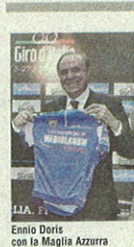
Ennio Doris con la Maglia Azzurra