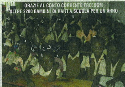
GRAZIE AL CONTO CORRENTE FREEDOM OLTRE 2200 BAMBINI DI HAITI A SCUOLA PER UN ANNO Oltre 2200 bambini di Haiti stanno andando a scuola, a di addebiare per tutta l'anno, grazie al Conto Corrente Freedom. Banca Mediolanum si è infatti impegnata, alla fine dell'estate scorsa, a versare alla Fondazione Francesca Rava - Nph Italia Onlus il corrispettivo per i costi di un mese di scuola di un bambino dell'isola caraibica per ogni nuovo conto Freedom sottoscritto tra il 1° ottobre 2010 e il 31 marzo 2011. Nel segno della massima concretezza e trasparenza di questa impegno sociale da parte della Banca, sull'account-page del sito www.bancamediolanum.it ogni settimana viene pubblicato e commentato il dato aggiornato dei risultati raggiunti.

Un conto corrente unico nell'intero panorama bancario italiano (anche se può già vantare qualche tentativo d'imitazione), e la sua unicità si