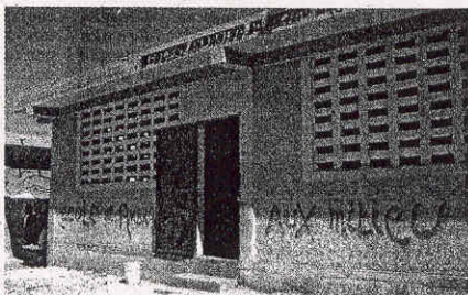
Da anni Fondazione Mediolanum opera ad Haiti: qui una delle scuole costruite

Fondazione Mediolanum da anni sostiene, attraverso il progetto “Piccolo Fratello”, le attività di Fondazione