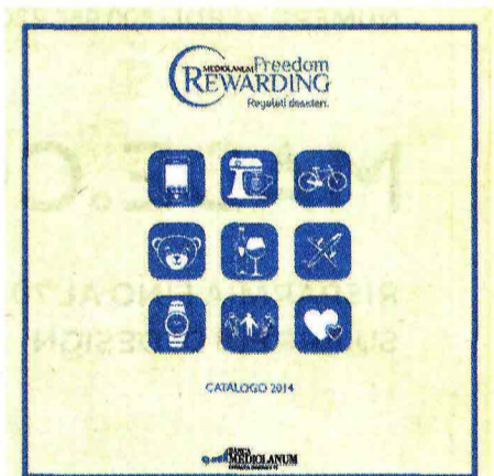
La copertina del catalogo di Mediolanum Freedom Rewarding

Allo stesso modo, è importante scegliere il conto corrente "giusto". Perché anche qui le differenze ci sono, possono essere importanti, e a conti fatti si fanno sentire nelle tasche dei rispar-